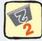
Marquage à chaud

Chacune de ces méthodes offre une solution tout en respectant votre cahier des charges. Nous vous proposerons la ou les techniques les mieux adaptés pour répondre à vos attentes.