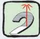
Marquage Découpe Laser